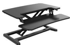
ERGO DESK 2

Pour lutter contre les TMS et la sédentarité, il est nécessaire de bouger plus, tout en étant capable d'être productif dans les tâches qui nous sont confiées. Les solutions assis-debout vous donnent la possibilité de dynamiser votre journée de travail. C'est pour toutes ces raisons qu'UNILUX vous propose une large gamme d'accessoires d'ergonomie allant du repose-pieds au bureau électrique en passant par un tabouret dynamique et une station de travail assis /debout. Etre plus actif est devenu un enjeu sociétal. Un premier objectif serait de passer au moins 2 heures par jour en position debout au travail, puis d'essayer d'atteindre une durée idéale de 4 heures.