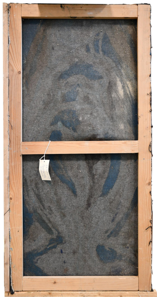
Vue générale, Revers, avant restauration