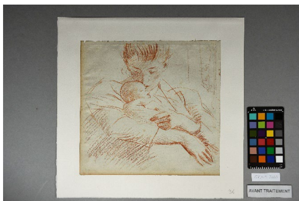
Avant restauration - recto

Dates de début et de fin de traitement : Octobre 2025 à décembre 2025