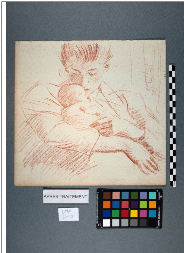
Après restauration - recto