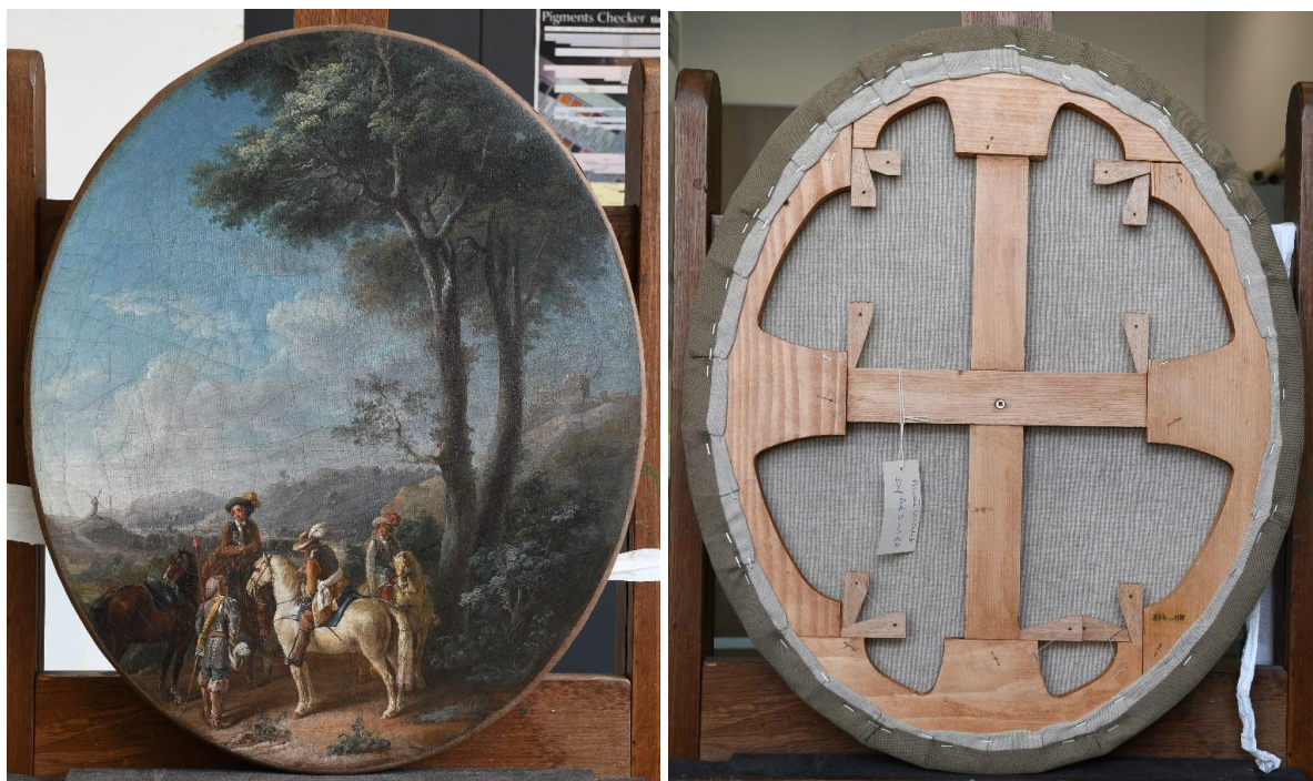
Œuvre après restauration