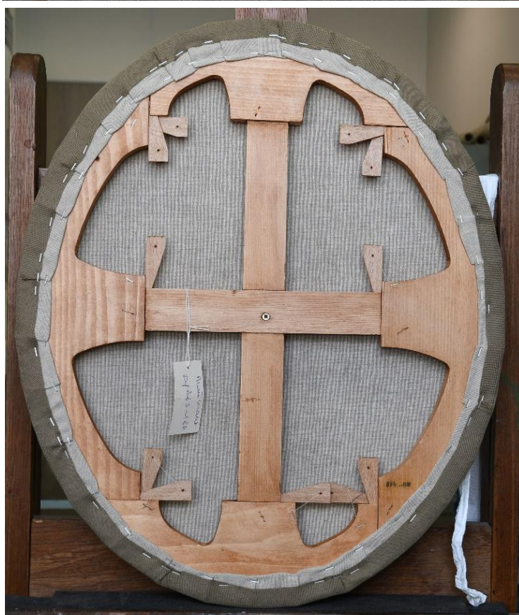
Œuvre après restauration