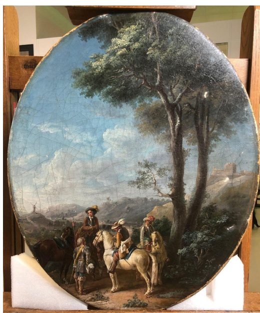
état après vernissage et masticage

Des mastics gris clairs de Modostuc® ont été apposés dans les lacunes en novembre 2023 par Arthur Viala.