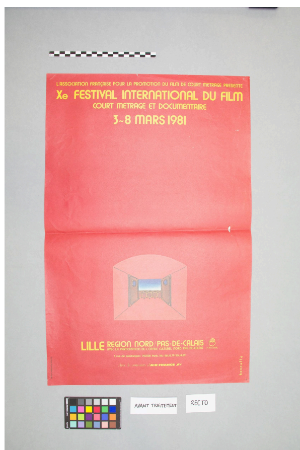
Vue du recto