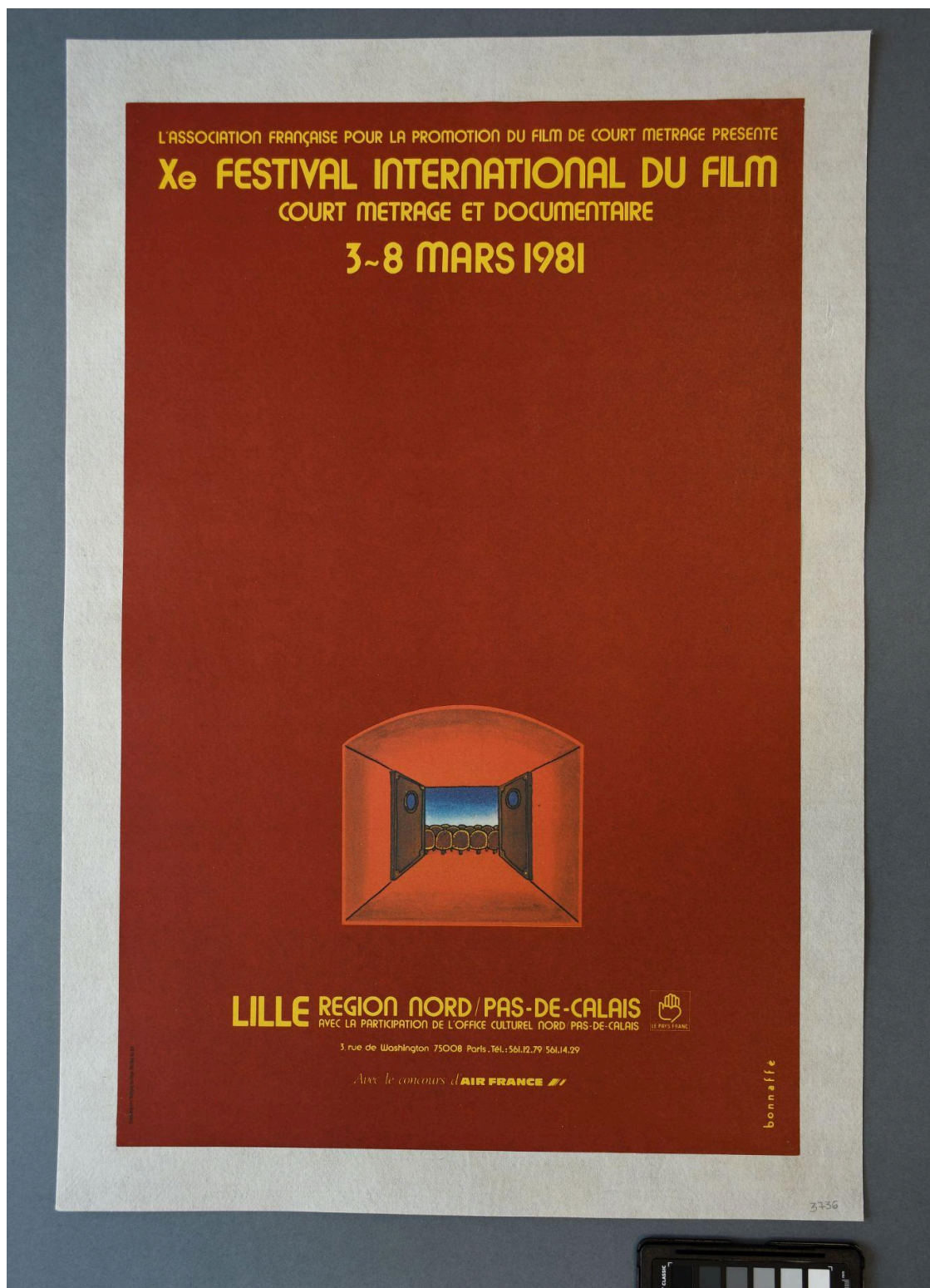
Vue recto du document - Après restauration