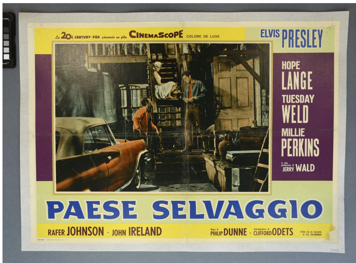
Vue recto du document - Après restauration