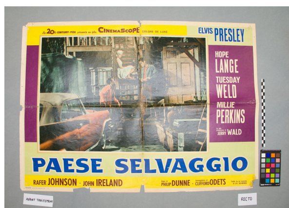
Vue du recto