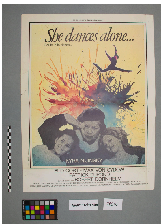
Vue du recto