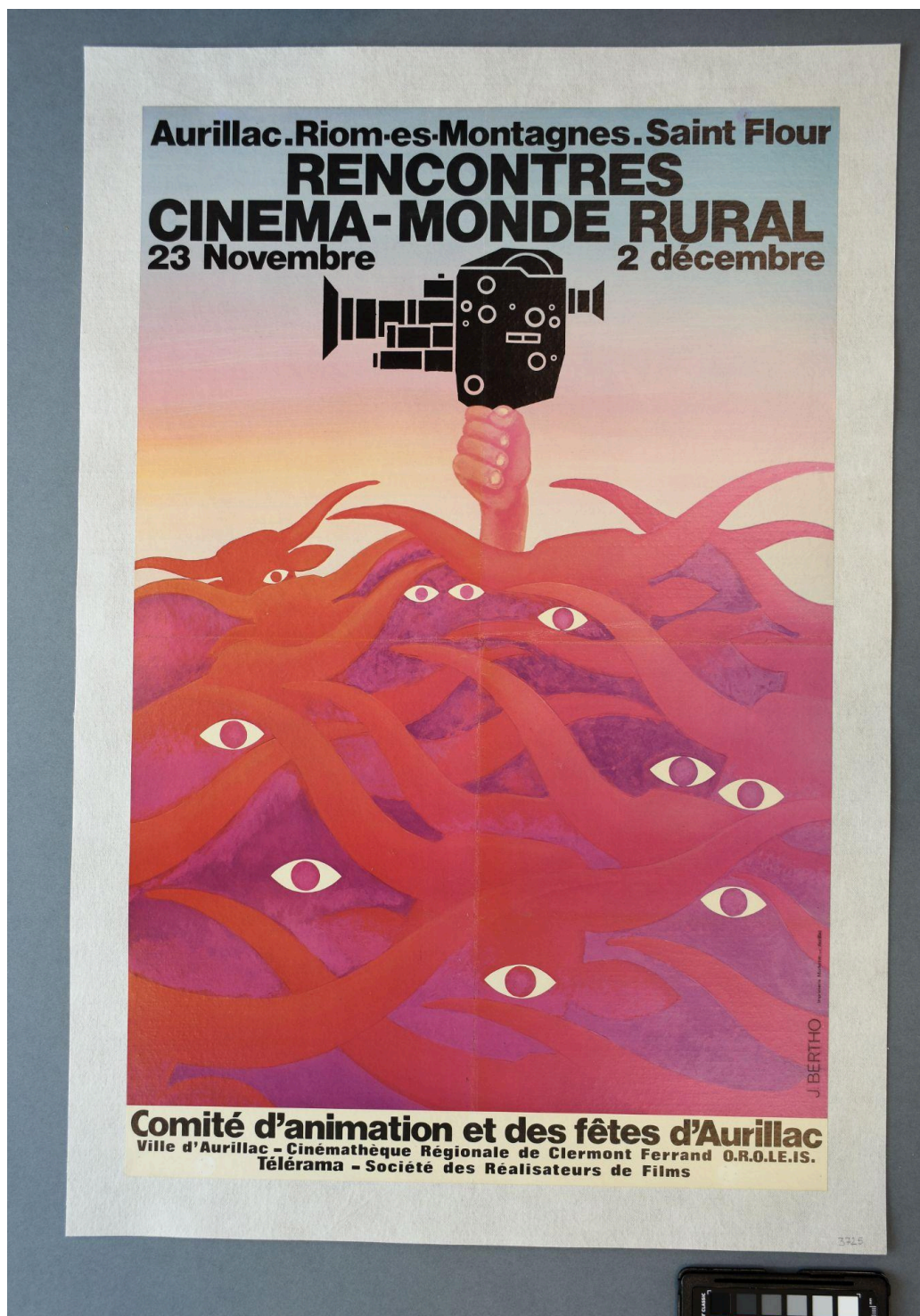
Vue recto du document - Après restauration