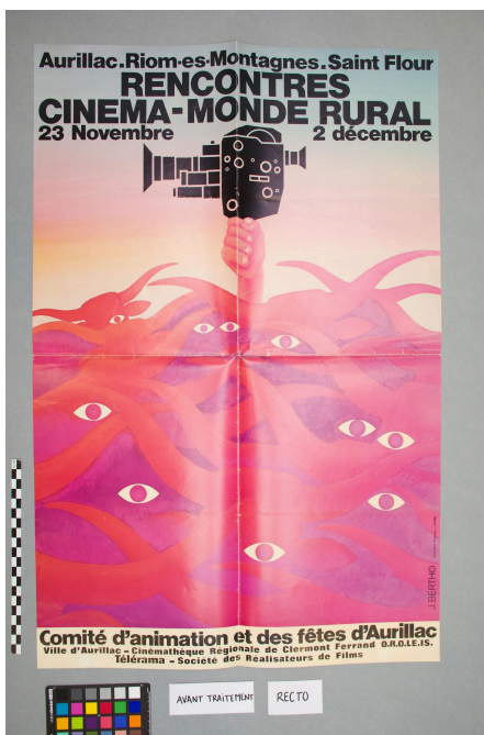
Vue du recto

Date de rédaction du constat d'état : 19/05/25