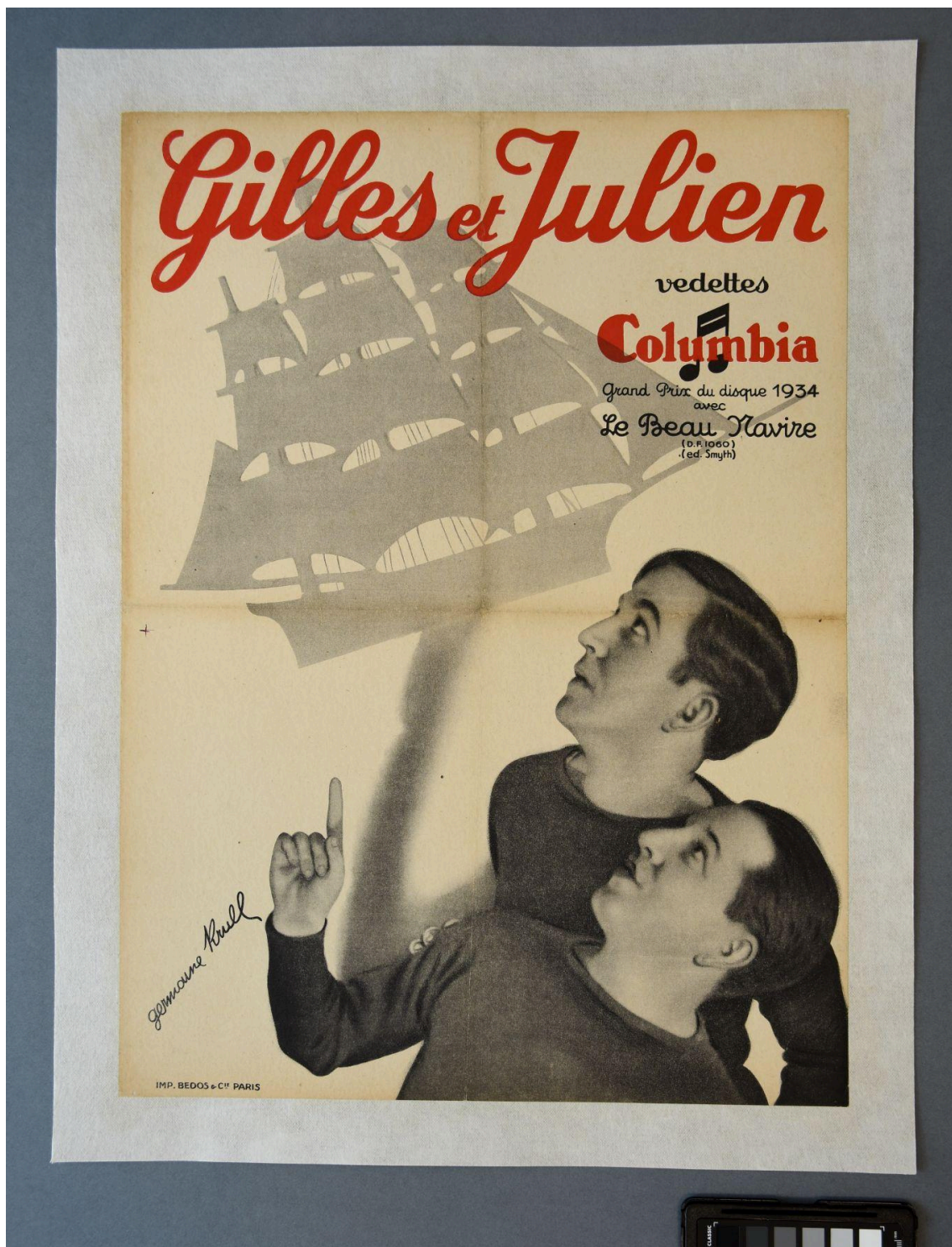
Vue recto du document - Après restauration