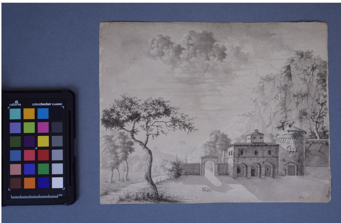
Après restauration Recto