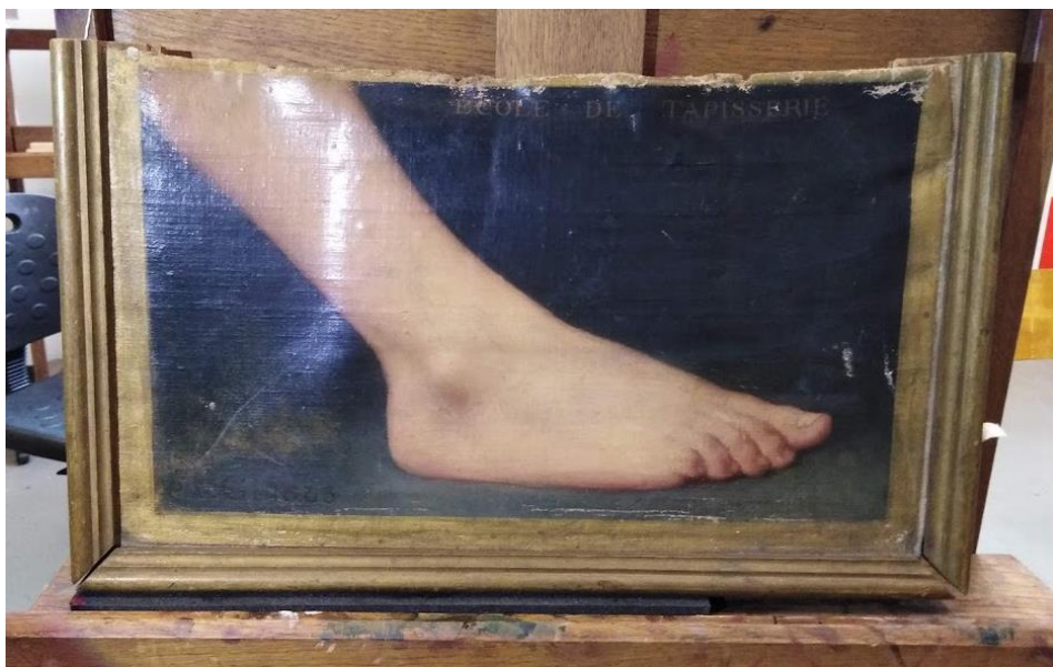
Tableau. Etude d'élève. Pied de profil.

Constat d'État et Diagnostic dans le cadre des cours de restauration de support toile