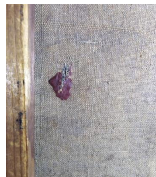
Déchirure et cire rouge, sur le bord senestre