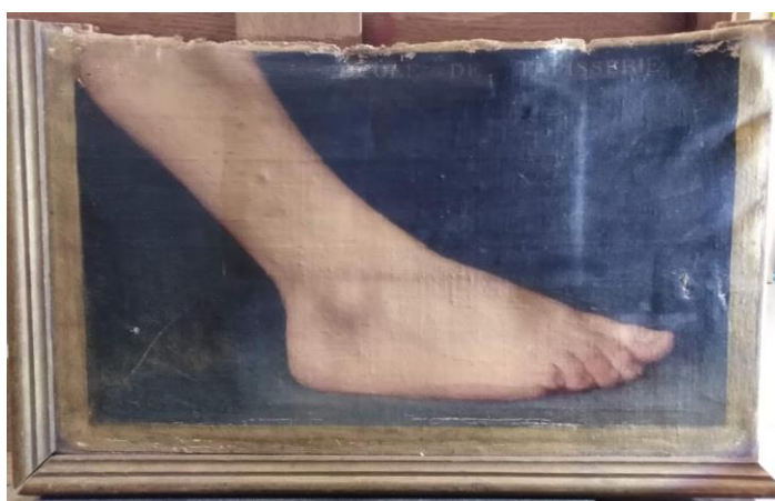
Vue en lumière rasante

La toile présente en outre des déchirures :