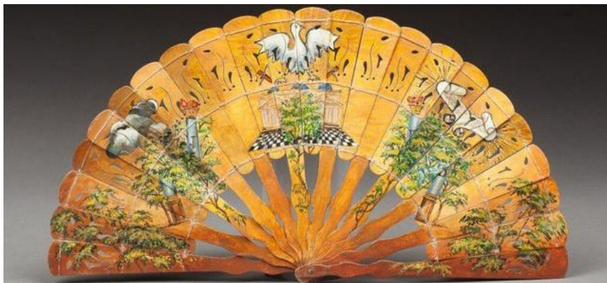
Un des objets précieux exposés au MAB (Musée des Archives de Bibliothèque de la Grande Loge de France)