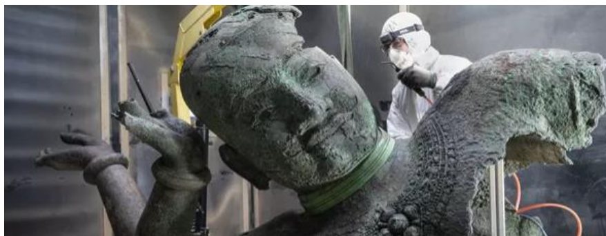
Vishnu couché du Mébon occidental en cours de restauration au Laboratoire départemental Arc'Antique