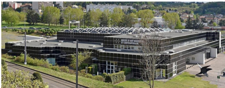
Réouverture du MAMC+ Saint-Etienne Métropole