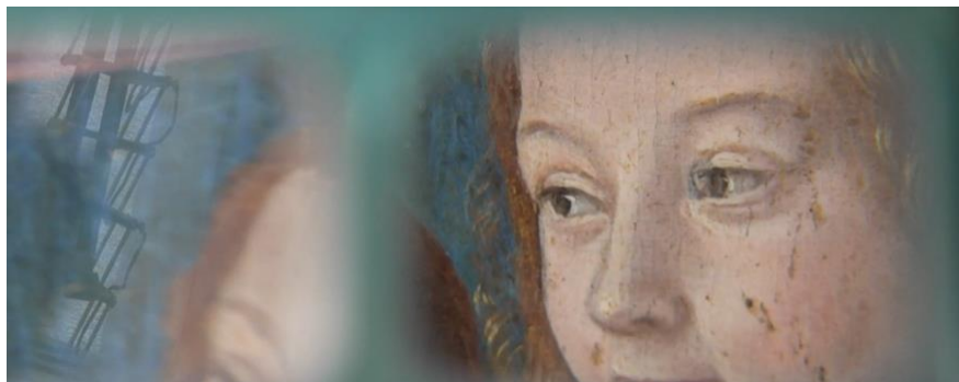
Au C2RMF Le triptyque de Moulins passe à la fluorescence 2D, une opération très délicate