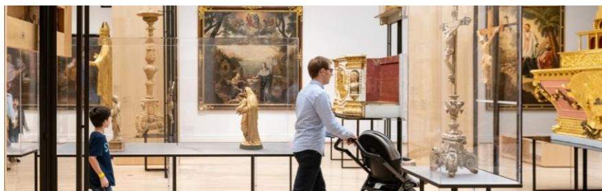
Les bébés ont-ils leur place au musée ?