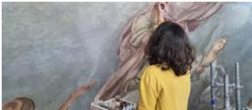
Saint-Sulpice - Les restauratrices ont travaillé sur 373m2 de peinture pour retrouver la fresque originale. Mai 2024