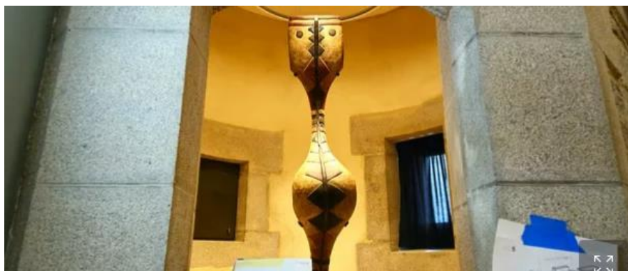
Masque serpent Baga (Guinée), donné en 2011 au musée Dobrée à Nantes

Le musée de Fourvière va (enfin) rouvrir après 7 ans de fermeture