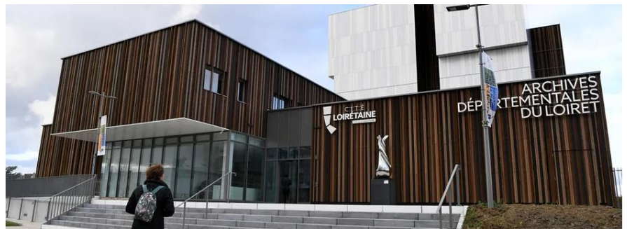
Parvis du nouveau bâtiment des Archives départementales du Loiret

Fusils Mauser, mitraillettes et pistolets : les « trésors » de la campagne d'abandon d'armes finiront au musée