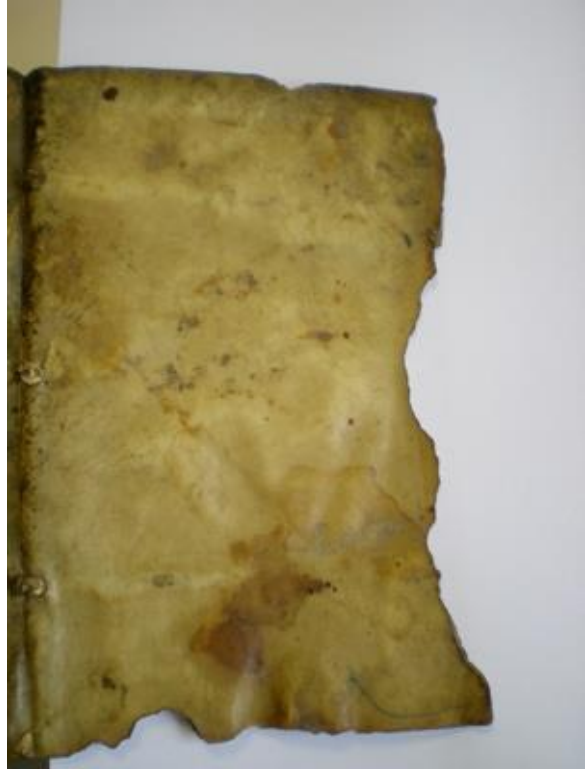
Vue couverture en parchemin.