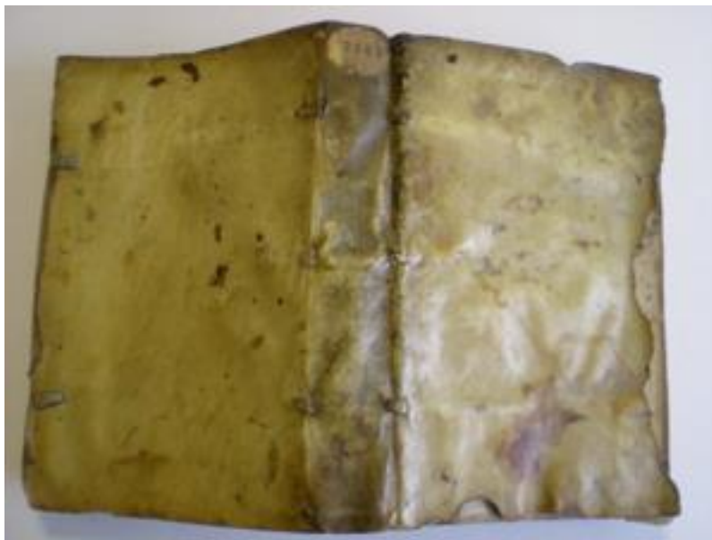
Vue générale avant restauration.