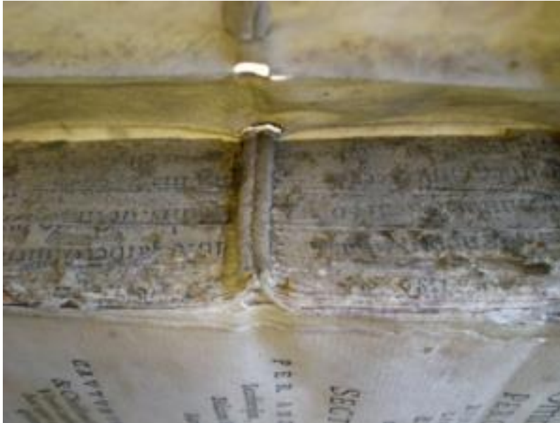
Couture sur doubles nerfs.