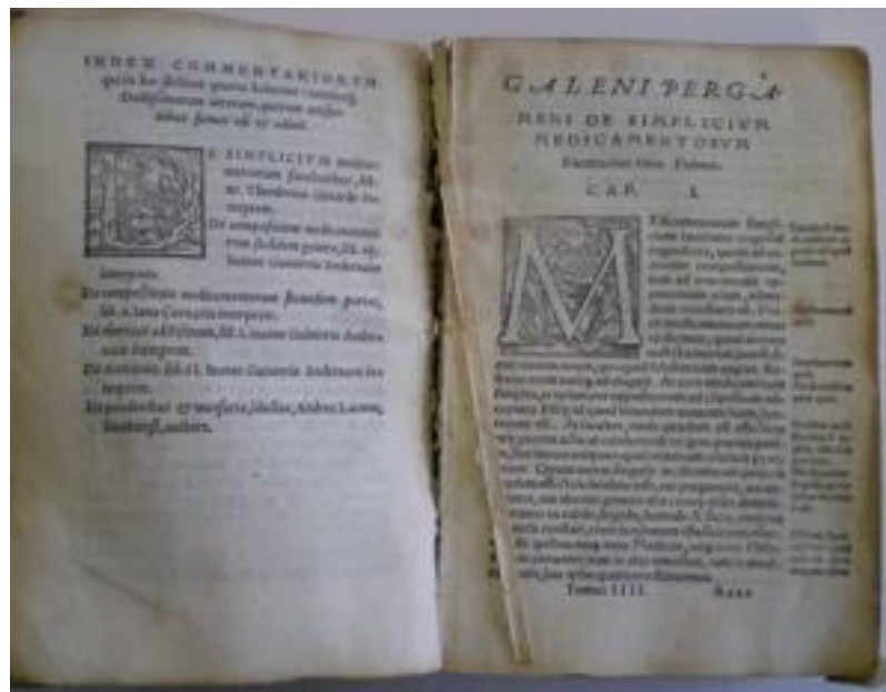
Etat de la couture

Quant au manque d'apprêt, il est responsable d'une mauvaise cambrure du dos qui est fortement concave