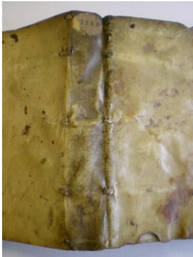
Vue du dos.