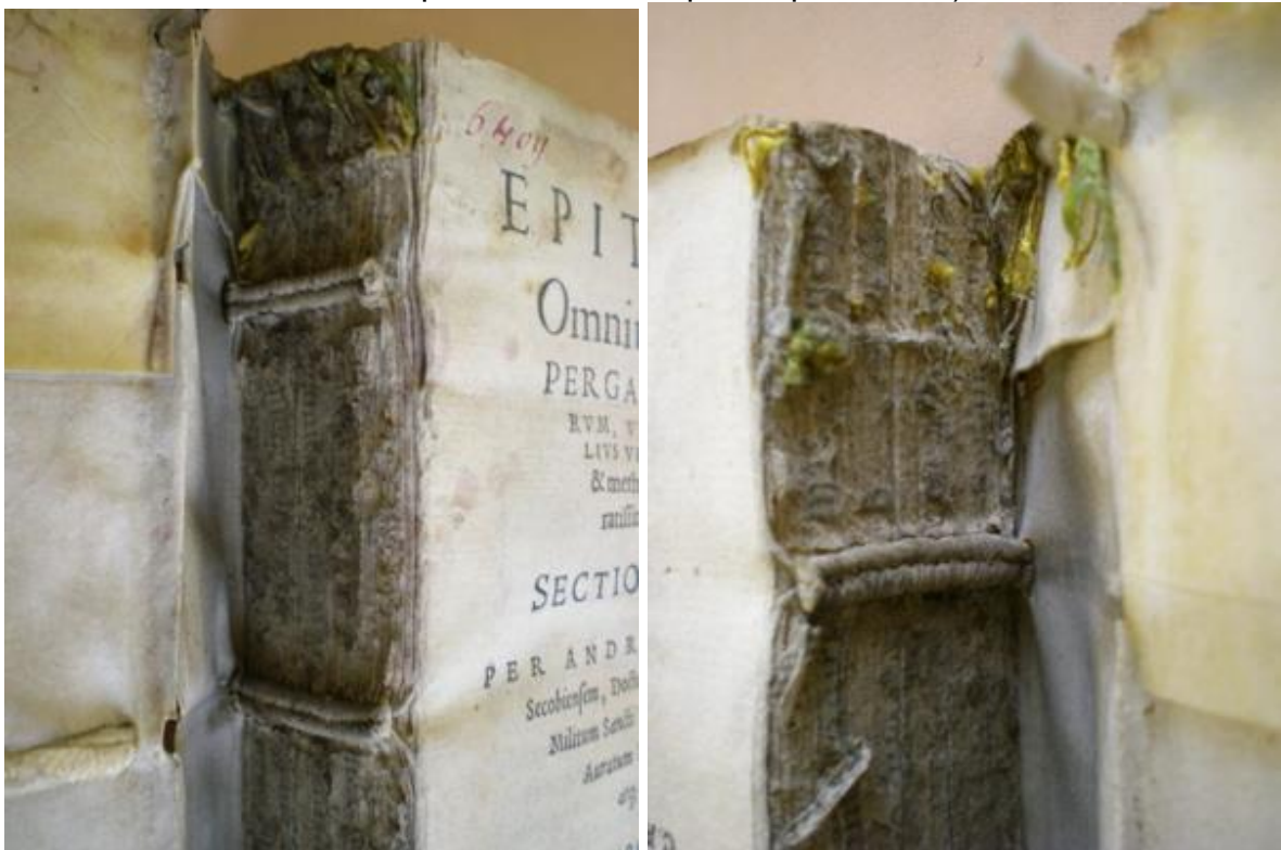
Tranchefile de tête à gauche et de queue à droite.