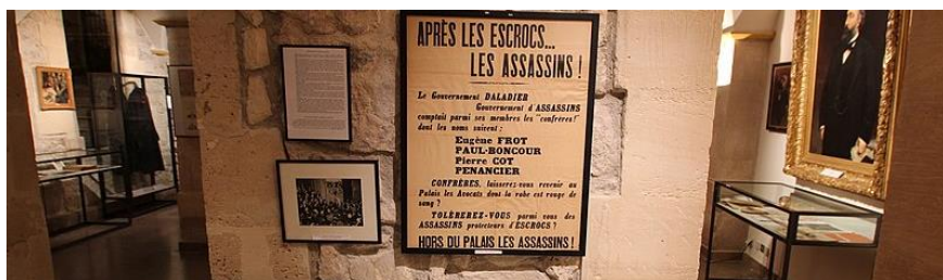
Musée du Barreau de Paris