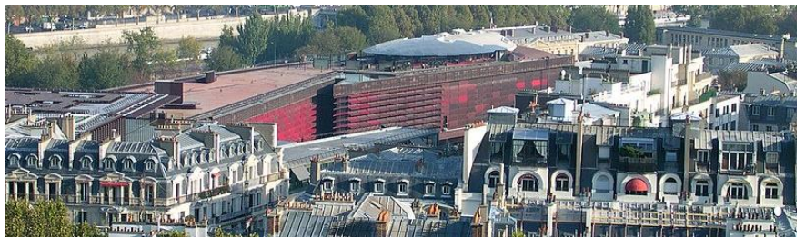
Musée du Quai Branly