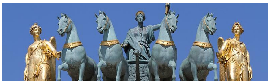
Quadriga de l'Arc de triomphe du Carrousel du Louvre

Afrique : Macron promet une loi pour encadrer les « restitutions » d'œuvres d'art Huffingtonpost.fr, 27/02/2023,