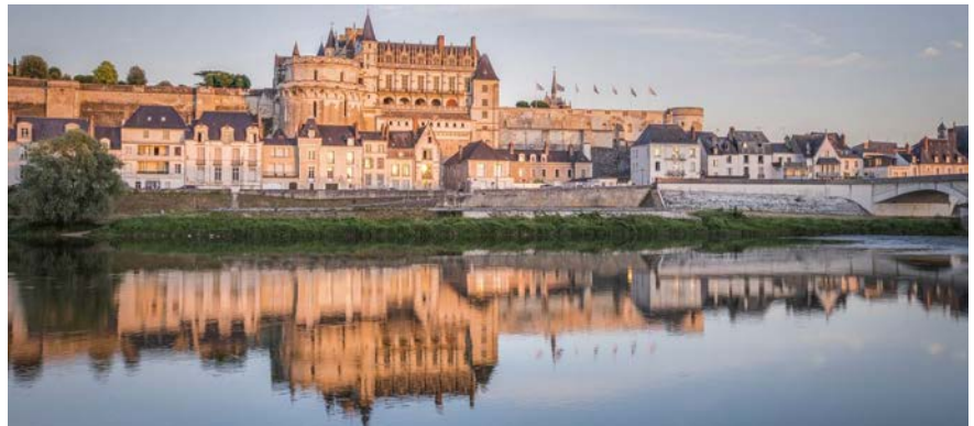
Château d'Amboise vu de la Loire - Le chantier symbole de la relance du patrimoine