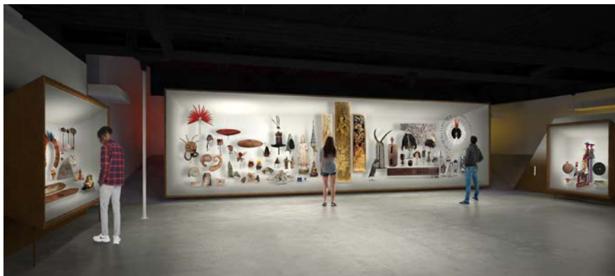
Musée des Confluences Galerie Émile Guimet : une galerie des donateurs