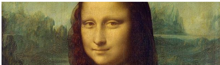
La Joconde de Léonard de Vinci, Musée du Louvre © Domaine public