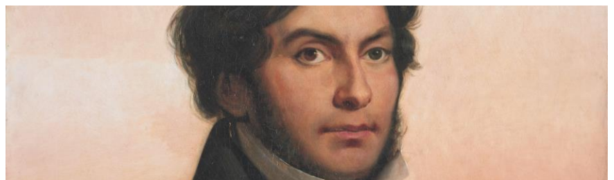
Jean-François Champollion, huile sur toile de Léon Cogniet en 1831 conservé au Musée du Louvre