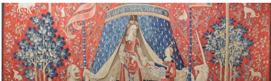
La Dame à la licorne, A mon seul désir