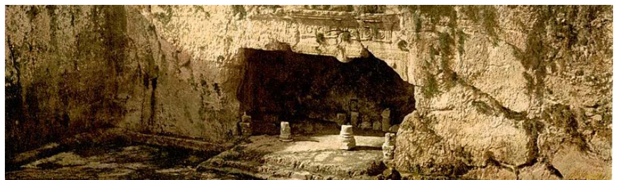
Tombeau des rois, Jérusalem, 1890-1900