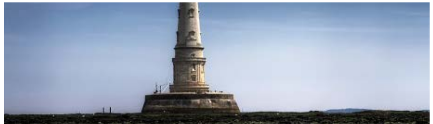
Phare de Cordouan, estuaire de la Gironde.