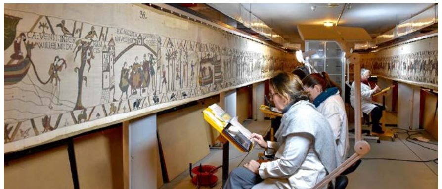
Tapiserie de Bayeux, constat janvier 2020