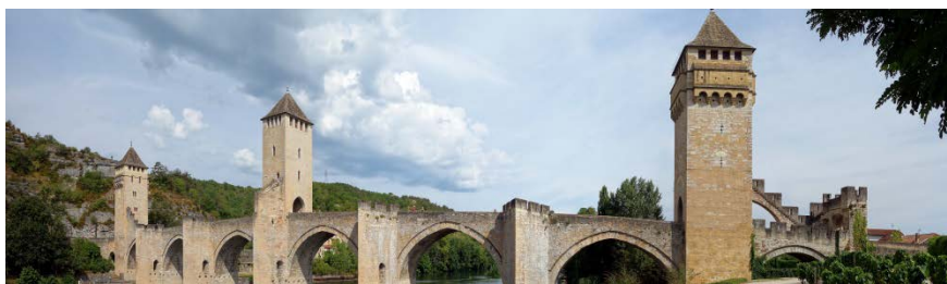
Vue du Pont Valentré à Cahors