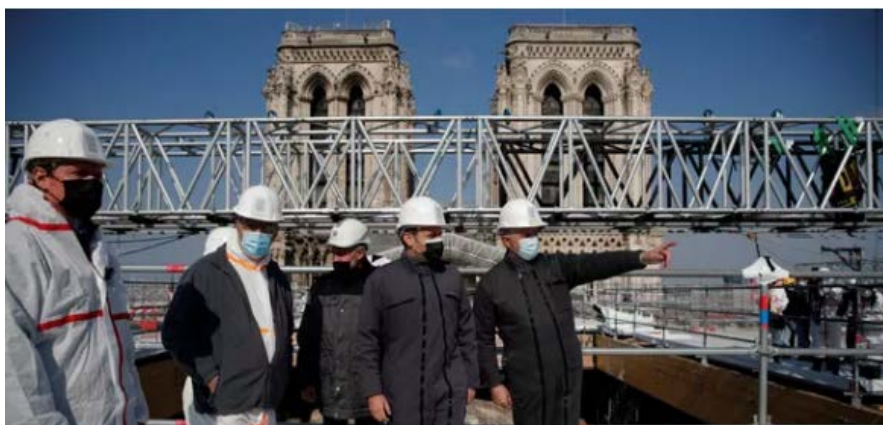
Notre-Dame de Paris : Emmanuel Macron sur le toit en travaux, deux ans après l'incendie