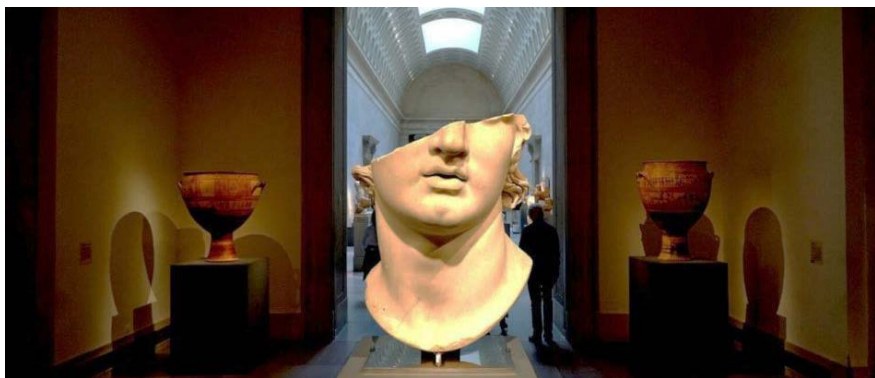
Le rapport de l'Unesco pointe les difficultés auxquelles les musées sont confrontés depuis le début plus d'un an à cause de la pandémie