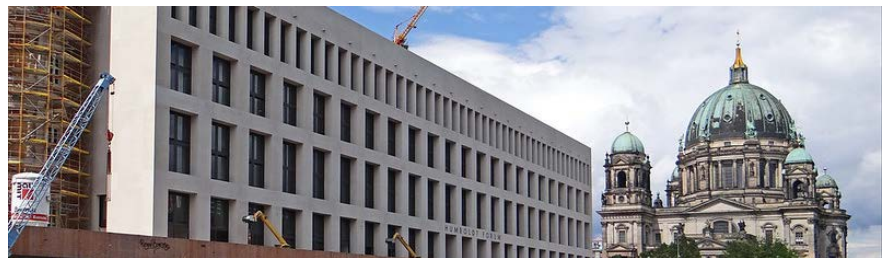
Le Humboldt-Forum en construction (Ancien palais royal de Berlin)