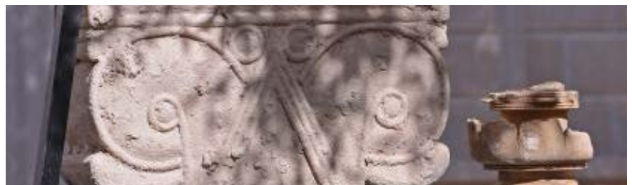
Chapiteau antique Jérusalem